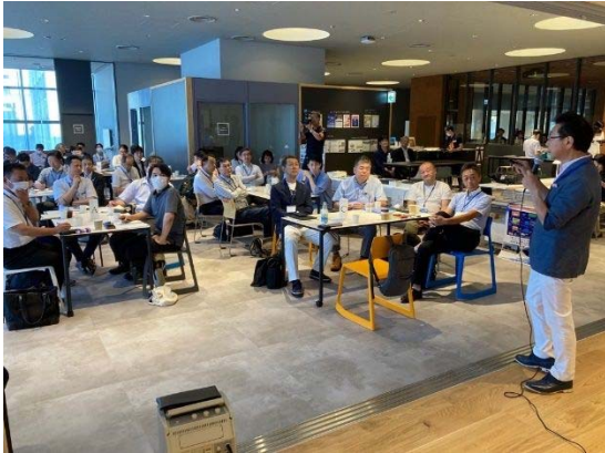
5階 イノベーションサロン 07/23 (日) バイオサロン