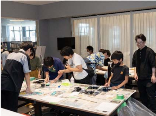
5階 ものづくりラボ 07/23 (日) 活版印刷しおりづくり