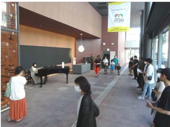
その他 0ストリートピアノ