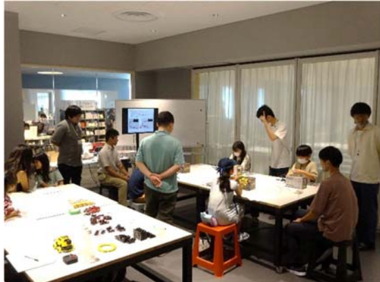
08/19 (土) 子どもパワエレ理科教室