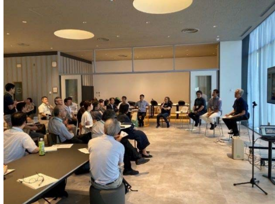
08/2 (水) 長岡ビジョン会議