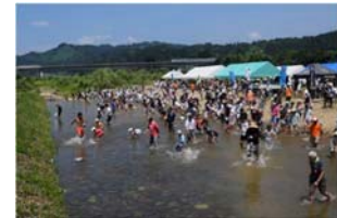
【じゃぶじゃぶ池の様子】