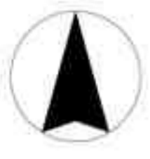
付図1号 土地利用計画図 長岡市（新潟県）