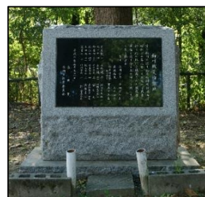
柿川戦災殉難地の碑