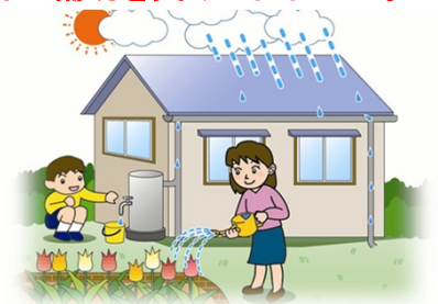
雨水タンクの利用イメージ

平成29年5月8日(月)から平成29年12月22日(金)まで ただし、予算が無くなり次第、終了します。