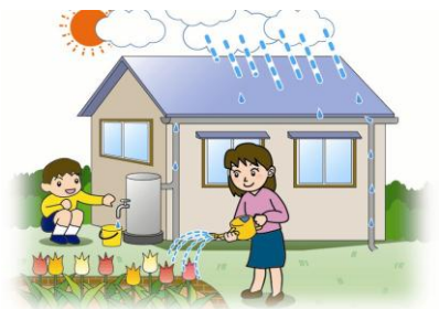
雨水タンクの利用イメージ

平成28年5月9日(月)から平成28年12月22日(木)まで ただし、予算が無くなり次第、終了します。