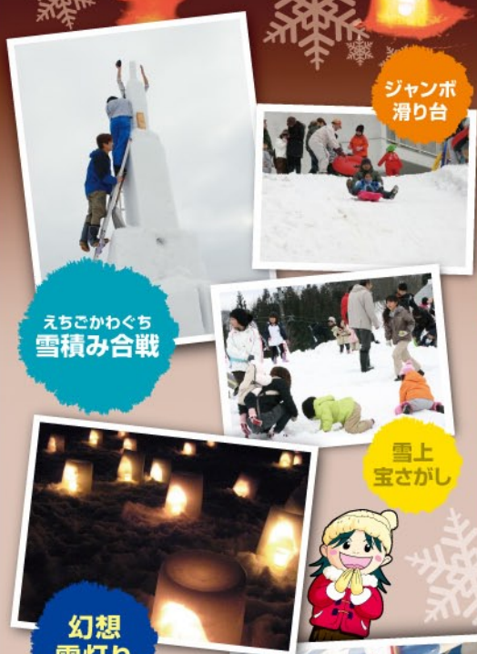
ジャンボすべり台