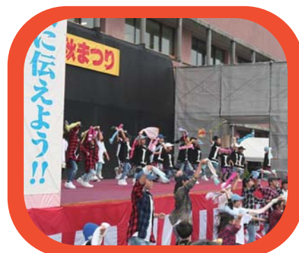
ステージ イベント