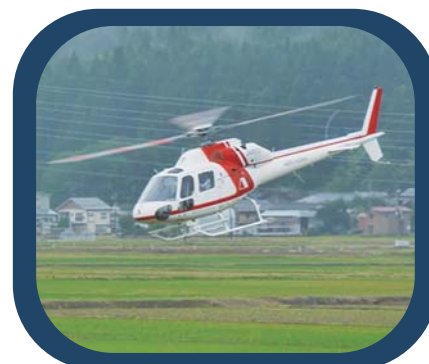
ヘリコプター 遊覧飛行