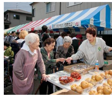
↑にぎやかな屋台テントがざらり