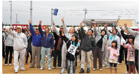
↑じゃんけんゲーム