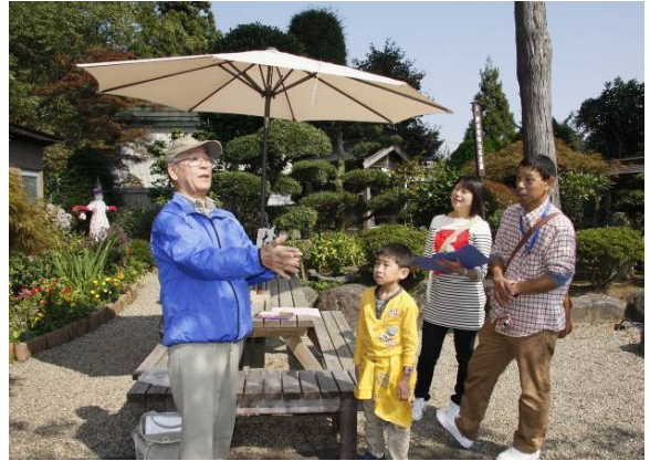
↑ 以南の句碑(上町)では手作り竹とんぼをプレゼント

生涯学習フェスティバル作品展(10月29日、30日)で参加者が撮影した写真を展示します。