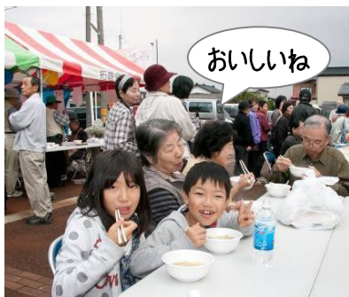
↑温かいサービス「お船なべ」