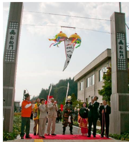
↑お船門で開催された遊歩道命名式典