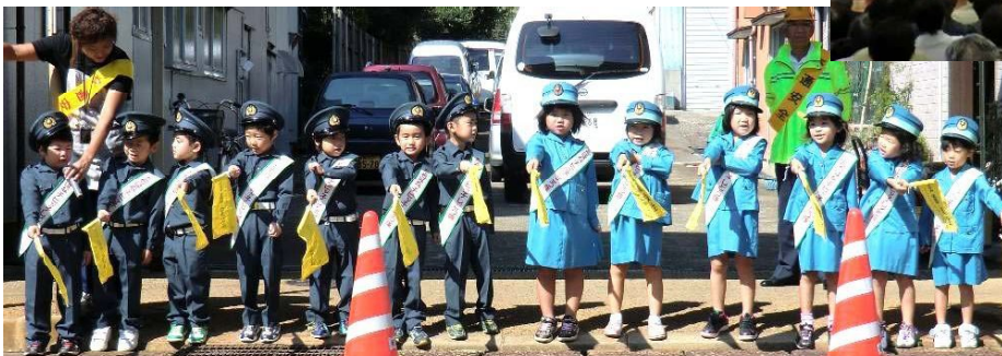
←「チビッ子指導隊」(与板幼稚園年長児) かわいい指導隊の登場に、ドライバーも笑顔。(9月28日)