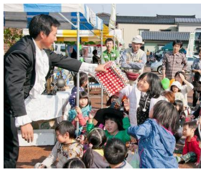
↑子供達に大人気マジックショー