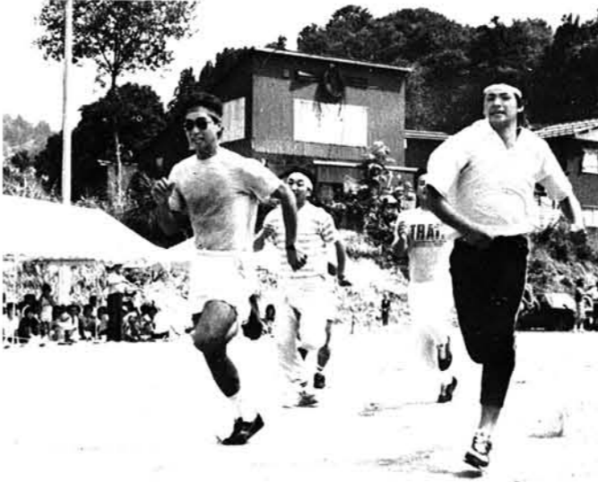
綱引き・歯をくいしばって 男子二〇〇m競争

今年で十八回目となった、村民総参加の「山古志村総合レクリエーション大会」。八月三十一日の日曜日、山古志中学校グラウンドで盛大に開かれました。 村内を五地区に分けた、五チームが参加。いずれのチームも参加者は、選手になったり応援をしたりと、一丸となって健闘いたしました。 「参加することに意義あり」の大会ですが、いちおう成績を紹介します。 ・優勝 竹沢 ・準優勝 東竹沢 ・三位 種芋原 ・四位 虫亀 ・五位 三ヶ 団体競技 ・紅白玉入れ 一位 種芋原 ・綱引き 一位 種芋原 ・大玉送り 一位 竹沢 ・年令別リレー(男)一位 東竹沢 ・リレー(女)一位 東竹沢 ・婦人バレーボール一位 竹沢