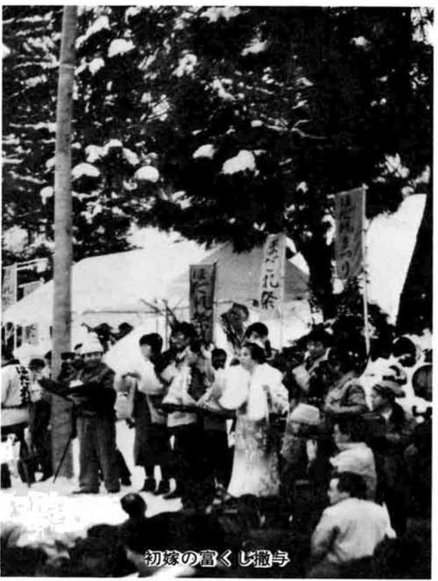
初嫁の富くじ撒与