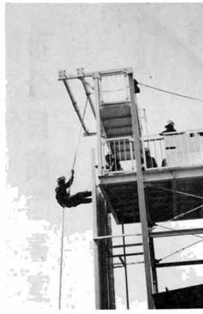
実践訓練にはげむ隊員

テレビのニュースなどで、火災や大きな交通事故の生々しい災害現場の様子が映し出され、その現場でオレンジ色の服を着た人たちが、警察官や救急隊員といっしょに活動しているのを見たことがあると思います。このオレンジ色の服装をした人たちが、消防救助隊員です。 栃尾市は、消防救助隊員の中から人命救助に関する専門教育を受けた者を、消防救助隊員に任命しています。 左の写真をご覧ください。 訓練塔で実践訓練にはげむ消防救助隊員です。 現在、九名の消防救助隊員が、ふだんから強い体力と気力を養い、ロープや各種救助