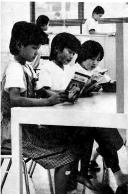
図書室で、好きな本を読む子どもたち

政府に売り渡すべき米穀に関する政令第一条の四の規定により、例年三月上旬に内示していた米限度数量の算定方式を、一部変更いたしました。 耕作面積七十パーセント、過去三年間の出荷実績の平均割三十パーセントで算定していた方式を、昭和六十三年産米から、耕作面積割百パーセントで配分いたします。配分数量に多少の変動が生じます このため、昭和六十三年度における需給ギャップ縮小(30万トン)が当面の課題となり、(1)需要拡大、(2)在庫調整、(3)地域の創意工夫を生かした需給ギャップ縮小の取り組みが掲げられています。 栃尾市には、緊急対策配分数量として十五万七千九百二十五キログラム、緊急対策