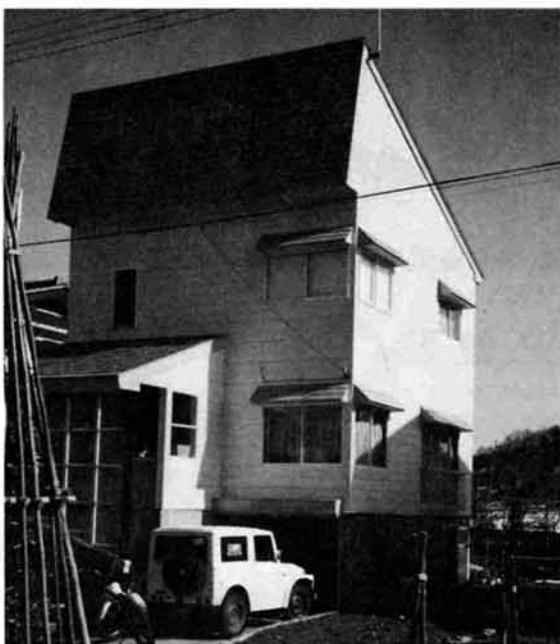
市内に増えてきた高床式住宅

高床式の住宅が、栃尾市内でも目立つようになってきました。これが高床式の住宅を建てる計画のある人で、次の要件をすべて満たしている住宅の場合は、固定資産税の減額措置と不動産取得税の価格の控除措置の適用が受けられます。 対象住宅 ① 積雪時における出入り、または居室の採光、もしくは換気の確保等のため、床下部分を通常より高くしたものであること。 ② 床下部分に、給水設備・ガス設備・収納設備・その他当該部分を利用するための設備を有しないものであること。 ③ 床下部分の床面積の二割相