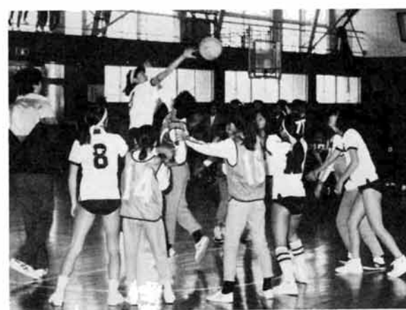
さあー、試合開始だ