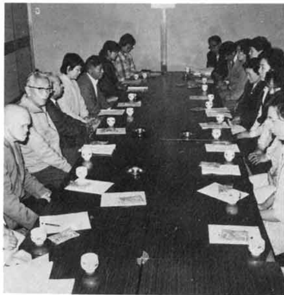
活発に話し合われた交流会

この日集った目の不自由な人は七人、小鳥の会員十人ほほえみの会員四人。交流会は、まず、今年の三月、車