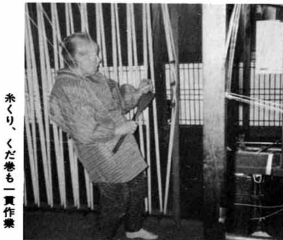
糸くり、くだ巻も一貫作業