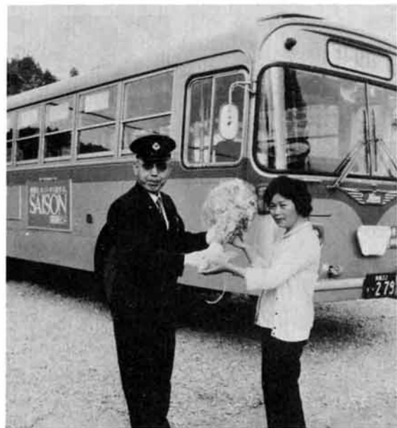
始発バスの運転手に花束