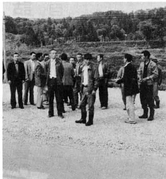
開設式を前にバスを待つ関係者