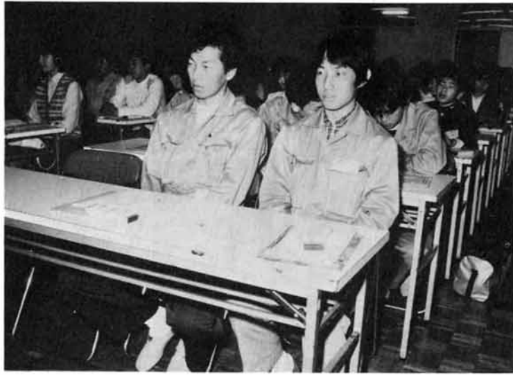
激励を受けた後、講演を聴く新卒就職者

ことし学校を卒業して市内に就職したかたを励ます「新規学校卒業生就職激励会」をさる五月八日、市民会館で行いました。