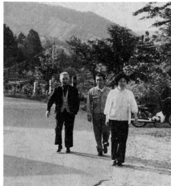
バスの出迎えのためかけつける人たち