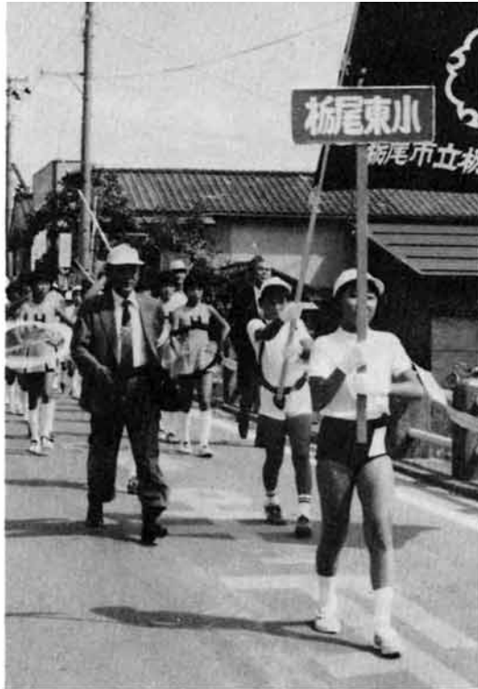
交通安全パレードに参加した児童連