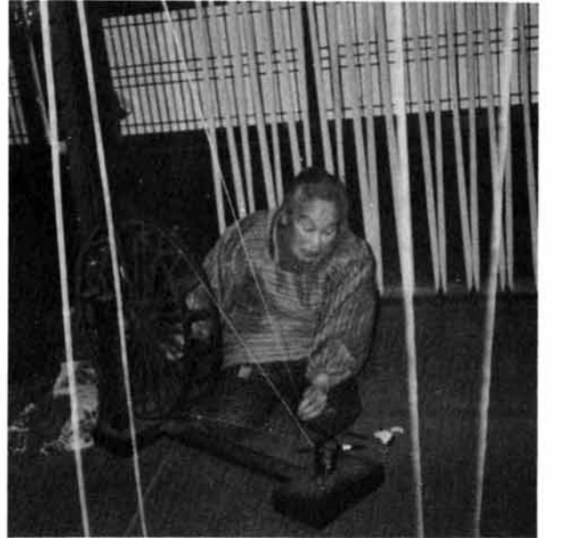
1人で組み立てた整経機で1回に20反もの糸を巻く

て住み込みしました。はじめ仕事は「糸くり」で、朝七時から夜十時までの労働時間です。もちろん、この時は電気もなく手動による機械とランプの明りでした。