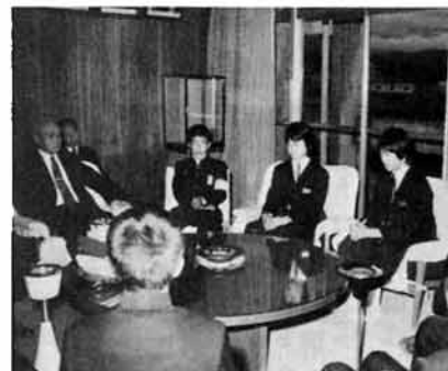
巡回の結果を話し合う中学生 (市役所で)

五月十一日から二十日まで、は春の交通安全旬間でした。この間、警察署、市、安全協会は、市内の中学生から朝の交通の実態を見たり、事故防止の呼びかけをもらったりした。登校前に、パトカーや交通指導車に乗ってもらいました。