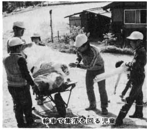
＝輪車で集落を回る児童