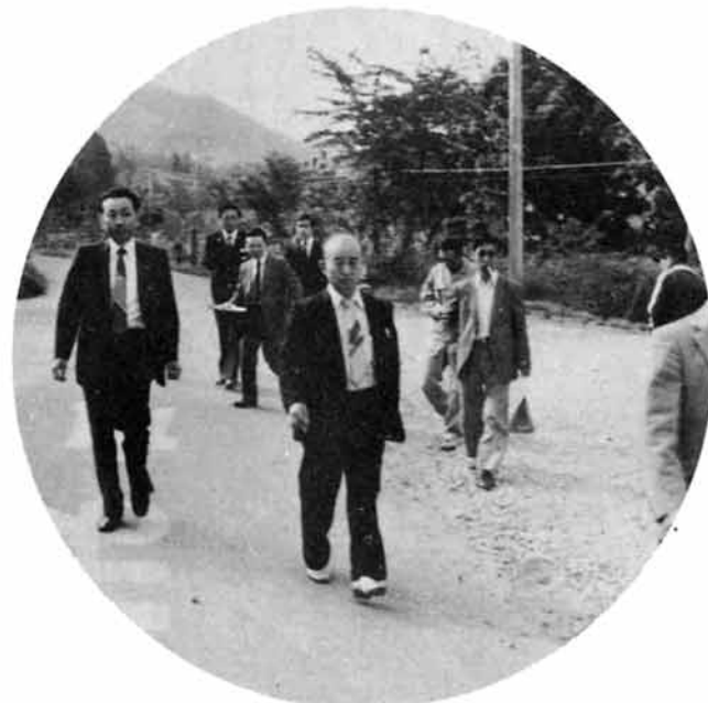
開通を祝って越後交通から小坂井運輸部次長もかけつけた