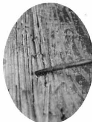
白アリに食い荒らされた荷頃小体育館の柱

荷頃小学校の体育館の柱に白アリが発生、営業した一本の柱は髓まで食いつくし、スポンジのようにフカフカになっていてとこを発見しまし