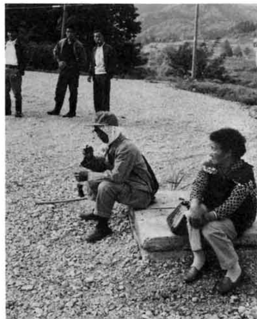
始発バスに乗ろうと6時前から待つ人も

本所までの路線バスは昭和四十五年六月まで通っていました。それも沿線住民の切望で昭和三十二年から運行され、大切な住民の足となっていました。三十九年六月二十六日に突如として襲った集中豪雨で島田・本所間が土砂くずれなどで復旧事業がはじまり、それ以来約十三年間運行されず不便を強いられていました。