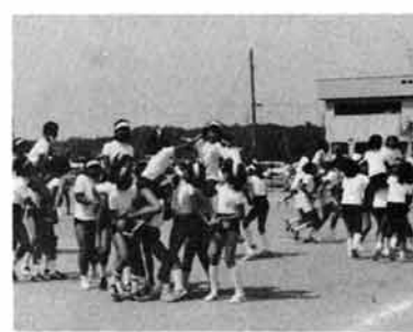
女子騎士も大奮闘...運動会で

市外地から少しはずれた刈谷田川と西谷川の合流点右手原町の大地に鉄筋コンクリート建ての校舎が見えます。これが栃尾東小学校です。本校は昭和五十二年四月一日、刈谷小学校と榎出小学校(現在は下堰小学校に統合)の一部、土ヶ谷分校が統合して、栃尾東小学校として開校しました。校区は、新栄町、栄町、山田町、新町、大町、金町、小貫、土ヶ谷、金沢、原町、巻洲、鴉ヶ島、水沢、岩野、楡原、栃倉、吉水、明戸の十