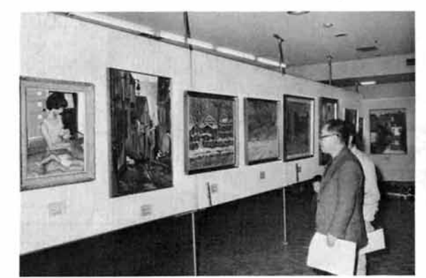
市民のみなさんから出品された大作・力作を 一堂に展示した、第11回市展が市民会館を会場 に開催されました。(11月22日から25日まで)

県消費生活センターでは、本市の消費者を対 象に、食品や衣料品の品質表示とマークの知識 について講座を開きました。(11月7日)