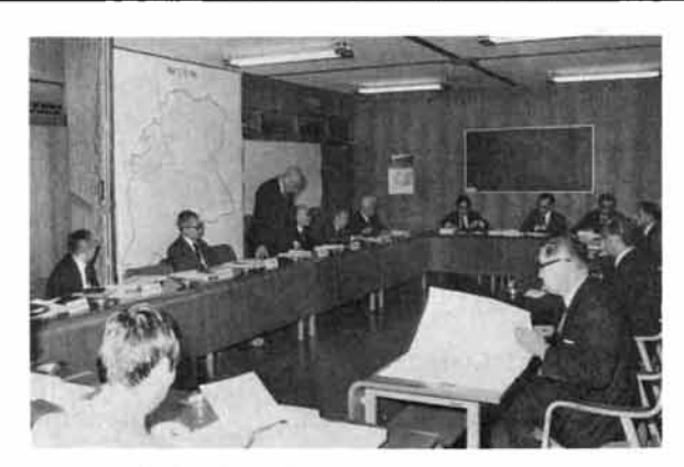
通産省工業開発指導員(一行13名)が来栃。 本市の工業誘致についての現地調査と助言指導 を行いました。(11月27日)