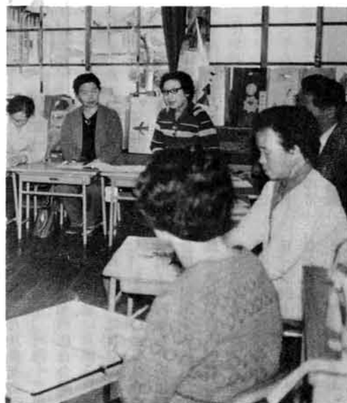
【今の子どもは……と話し合いが】

現代の激しい社会変化は家庭のなかに大きな影響を与えています。たとえば①核家族化が急速に進み、少人員世帯が増加しています。少人員世帯の核家族では過保護型、または放任型、教育過剰などになりやすく、子どもの自主独立心がなくなったり、非行化を起しやすくなるなどの問題が心配されます。②出かせぎ、共働きの家庭が増加し、親子の接触が少なくなっています。この結果過度のいき愛や、物的代償によって親子の関係を保とうとする傾向が生じてきているようです。