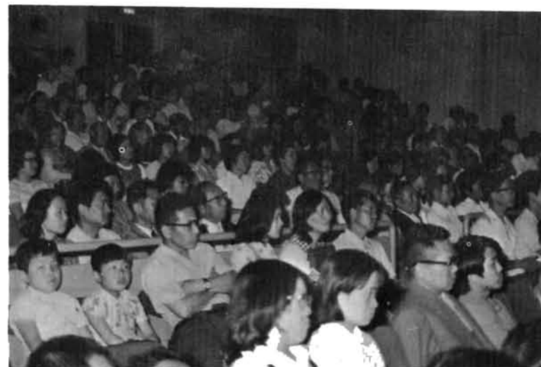
ユーモアをまじえたたくみな話術で、会場にはときどき笑い声も……

市制20周年と栃尾青年会議所設立5周年の記念事業の文芸春秋社主催の文化講演会が、さる6月11日新装なった市民会館大ホールで行われました。市内ではじめての本格的ホールで照明など演出効果も万点、三人の講師がそれぞれ持味を出したたくみな話術で、約600人の聴衆を魅了した2時間30分でした。