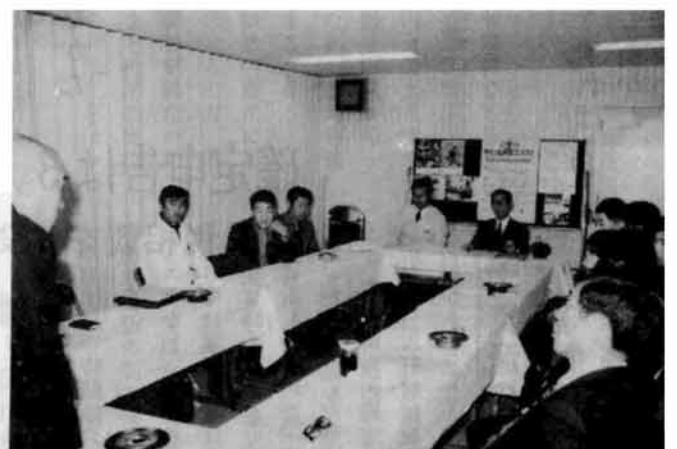
△ 半蔵金、中野俣地区の人が多い。ここの通 年従業者には、経験豊かな当市の出かせぎ者 が指導に当った。〔紀文静岡工場〕