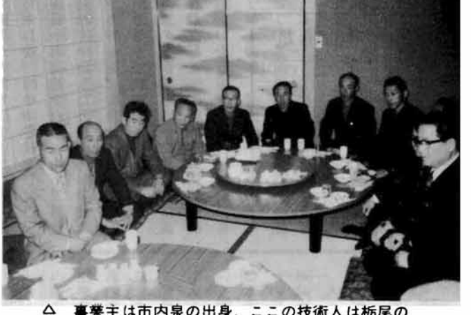
事業主は市内泉の出身。ここの技術人は栃尾の 出身者で、就労者は東谷、一之貝、軽井沢地区の 人が多い。〔㈱武士俣組〕

▽東京鋼鉄㈱(東京都江東区) ▽㈱武士俣組(東京都足立区)= ▽㈱紀文静岡工場(静岡県島田市) 第二日目(二十九日) ▽鶴岡寒天水産加工業協同組合( 岐 第一日目(二十八日) 第三日目 (三十日) 拡削した事業所 了寒天工場、②寒天工場、闪寒 場、黛寒天工場、 阜県恵那郡山岡町)= 天工場など一三事業所 (事天工場、 五五人 四五人