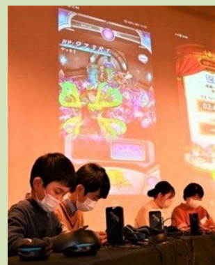
eスポーツ体験イベントの様子 (令和5年2月、アオーレ長岡)