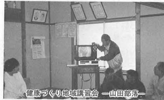
健康づくり地域講習会 山田部落