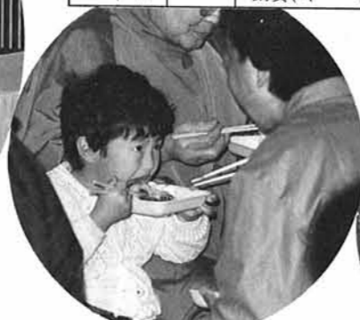
おばあちゃんおいしいー