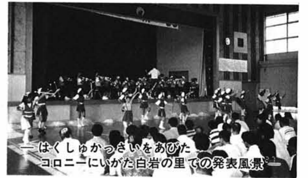
— はくしゅがっさいをおひたコロニーにいがた白岩の里での発表風景 —

り組み、えきの量や施肥に悩みながらもいっしょうけんめいがんばりました。開花した時の喜びなどは何とも言えない気持ちでした。