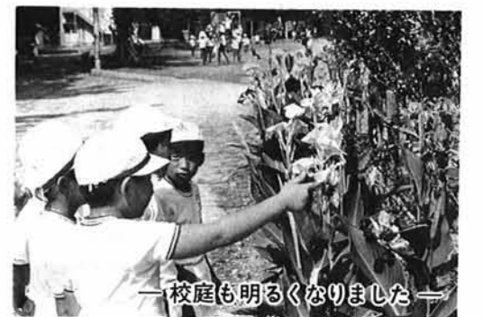
— 校庭も明るくなりました —

「この活動を行なったから子供達が明日すぐ変わるものではない。違った世界を見たり、体験したりすることに意義があるのではないかと思う。事例をあげれば、ゴミ拾いの活動では、子供達は自らすすんで大きなもの、きたないものに挑戦していましたし、老人ホームへの慰問のなかでは、子供達が