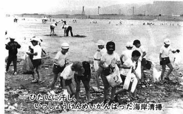
— ひたいに汗し、いっしょうけんめいがんばった海岸清掃 —

寺小小学校では、子供達の豊かな「心」の育成を図るため、昭和六十一年度より、新潟県の補助事業である「豊かな心を育てる教育活動推進事業」に積極的に取り組み、着々とその成果をあげています。 この事業は、子供達に社会奉仕活動や勤労体験学習等の体験的な学習活動を通して、奉仕の喜びや人を思いやる心を育てるとともに、ふるさとの自然や文化に触れ、郷土を愛する心、草花の栽培や動物の飼育を通しての生物をいっしょに育てることをめざした事業です。 先生と子供達が二年間、いっしょうけんめい取り組んだ活動をおつてみます。