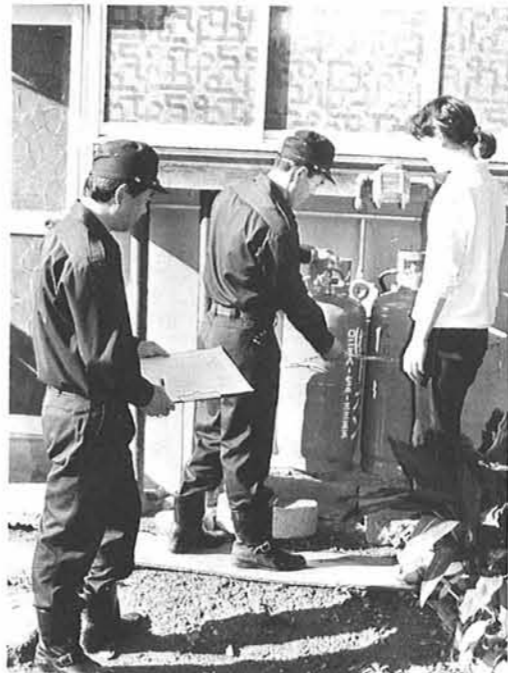
真剣に、家庭における防火指導する消防団員

付近の住民から一九番通報、地域の火災による消火栓からの放水と、地元小型ポンプの出動放水など、緊張した訓練のなか、こんどは強風にあおられ住宅に延焼の恐れありと判断、分団長が分団内(田尻、入軽井、矢田)の小型動力ポンプの出動を求めると、実践さながらの訓練が展開されました。その後、町軽井のみなさんを対象に消火器の使いかたの訓練を行いました。