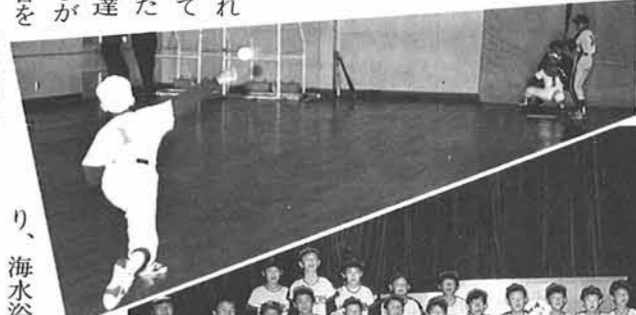
みんなそろって記念撮影

当日は、寺泊少年野球大会で優勝した本山小学校の「本山コンドルス」と対戦する予定でしたが、あいにく雨天のため中止となりました。張り切って訪ずれた選手、役員そして父兄の人達、迎えた本山小学校の子供達は、雨空を見上げながら異口同音に「試合をしたかったな」と、残念がっていました。それでも午前中は当町自慢の水族博物館を見学した