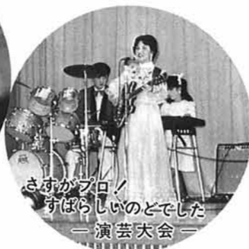
さすがプロ！すばらしいのどでしたー 演芸大会