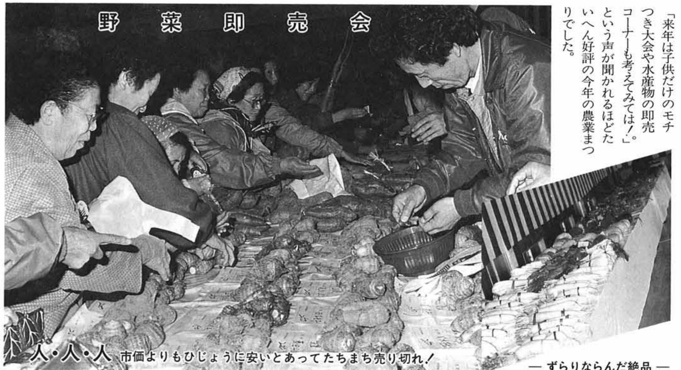
人・人・人 市価よりもひじょうに安いとあってたちまち売り切れ！ — ずりりならんだ絶品 —

「二、〇〇〇人が集まり大盛況」 「つくる喜びを真心こめて、消費者に」をスローガンに、町と農協が共催し、農業まつりが、11月8日町体育館で開かれ、盛りだくさんの催しもので終日にぎわった。 この農業まつりは生産者と消費者のふれあいを求め、お互いの理解を深め、農業の大切さを見直していただくことと企画されているのです。 会場では、各農家が出品した自慢の農産物の品評会や優良農家などの表彰式がおこなわれたあと、 また、とれたてのコシヒカリが百五十人に当たるコシヒカリブレゼントの抽選会には、先着千名までの空くじなしと聞いてか、長蛇の列となり、押すな押すなの大盛況、屋外に設けられた、野菜、果実、キノコなどの即売コーナーでも、市価より安いとあって飛び交うように売れ、「寺泊町にこんな出来のよい農産物があったとは知らなかった。しかも、新鮮なものが市価よりも安く買えるとは！」 アトラクションとして、モチつき大会、演芸大会、コシヒカリブレゼント抽選会がおこなわれました。今年はいよいよ天候に恵まれたせいもあってか、住民の足も順調でどの会場も黒山の人だかり、特にモチつき大会には身動きできないほどで、あたたかいつきたてのものに訪れた人のおなかにおさまりの顔も満足そう。