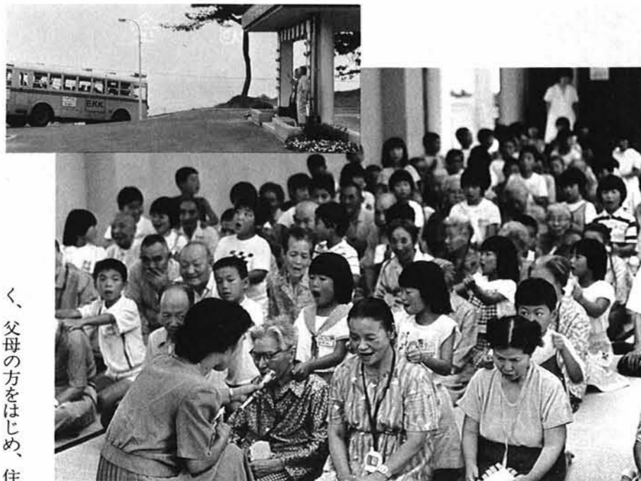
— おじいちゃん、おばあちゃんにたいへんよろこばれた老人ホームでの肩たたき —

ら肩をたたいてもらっていたお年寄りが涙ぐんだり、別れの時など見えなくなるまで手をふって名残りを惜しんだり……、このような感動的なシーンを目のあたりにして、子供達の心の中に少なからず何か変化がおこっているのではないかと思う。補助事業の年限が終っても、現在の「寺小タイム」という子供達の創意ある教育活動をめざした寺小独自の時間帯などを利用して、もっとも長く続けたいし、また続けなければならぬことと思う。そして、父母の方々には、子供達が家庭に帰り、一日のできごとなどを話しかけているとき、この子供達の言葉をさげり、心をときしてしまつような言動はさけていただきたいと望みます。家庭も一体となった事業にしたいから……と。