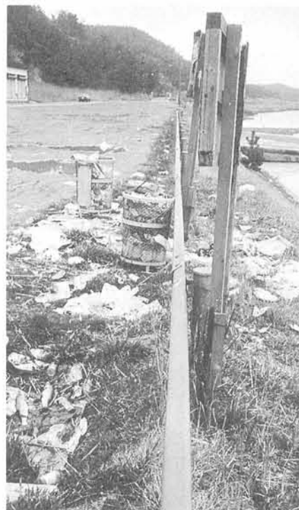
この現状をあなたは……?