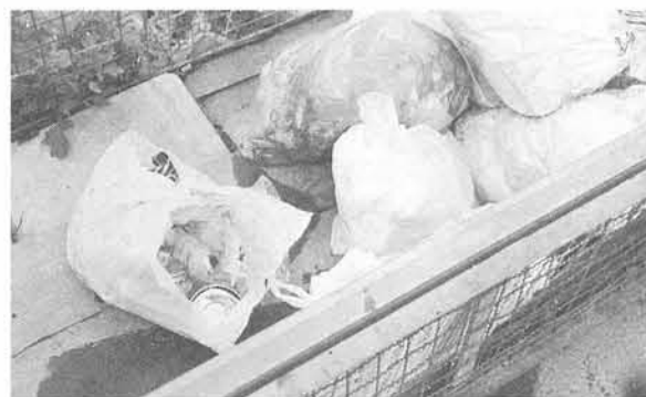
きちんと包装してから出しましょう

◎ゴミ収集 夏は暑さのため、水分の多い食物の摂取が多く、家庭から出るゴミも含水率の高いものとなります。皆さんの家庭から出されたゴミは