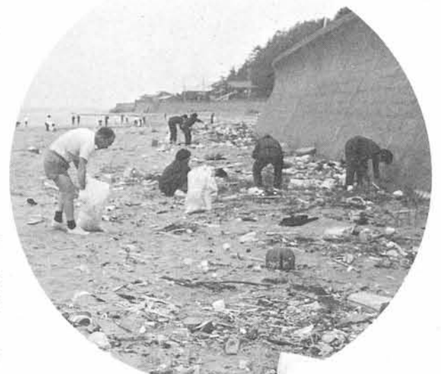
長時間にわたり、ご奉仕いただいたボランティアの皆さん