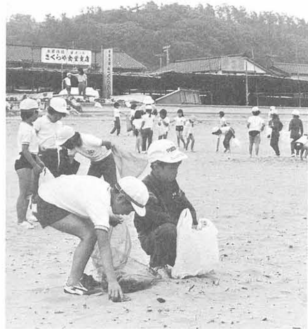
額に汗し、いっしょうけんめいゴミ拾いをする子供たち

町では、観光協会や商工会に呼びかけ、観光地「寺泊」がゴミのないきれいな街・また訪ねてみた