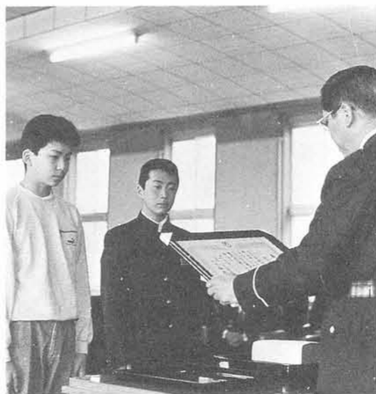
与板警察署長から表彰を受ける大町少年団代表

気よく続けております。この長年の奉仕活動でこれまでに青少年育成新潟県民会議、明るい社会づくり新潟県推進会、新潟県消防協会などの表彰に続いて、このほど与板警察署の推薦で、小さな親切運動本部から表彰され、四月二日町役場で伝達式が行われました。