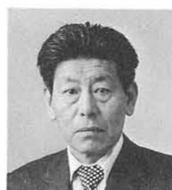
近藤 重治郎 敦ヶ 曾根 農 業