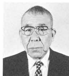
小黒 東伍 町 軽井 農 業