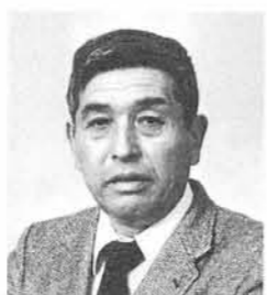
八子 一 萬 善 寺 農 業