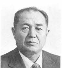
足立 昭二 志 戸 橋 農 業