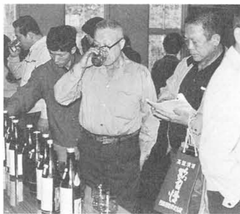
一般公開でにぎわう会場