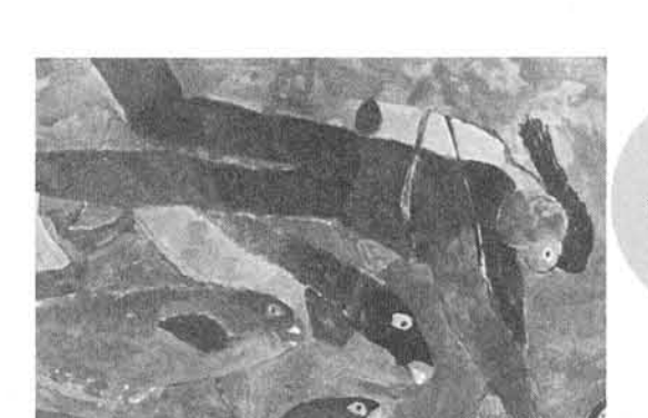
審査員評 すらりとしたマリンガールのお姉さんが、餌をやっている絵であり、そのお姉さんの餌をもつ手にすべての力、すべての目が集まっています。また、餌を求める魚の目と動きがとてもよ く表現されている作品です。