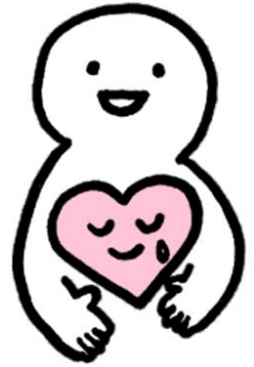
長岡市こころの健康づくり シンボルキャラクター ほっとちゃん