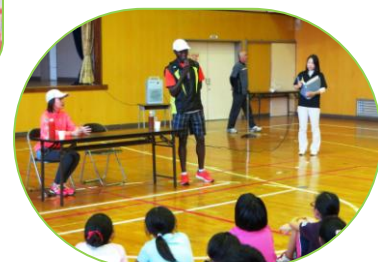
▲ゲストランナーによるランニング教室の一コマ(10月17日)