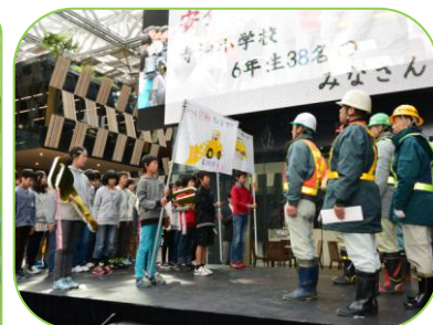
▲「寒さに負けず、お体に気をつけて頑張ってください」と激励しました。