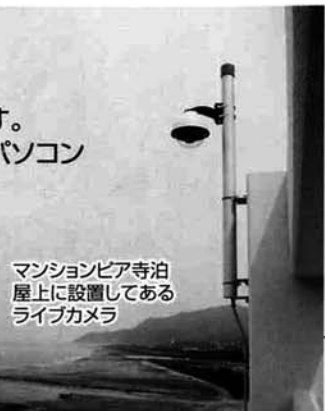
マンションピア寺泊屋上に設置してあるライブカメラ

http://www.niigata-net.or.jp/teradomari/