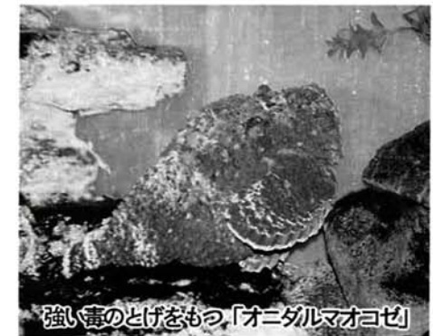
強い毒のとげをもつ「オニダルマオコゼ」

とげをもつハオコゼやオニオコゼ、岩のようにカモフラージュするオニダルマオコゼや尾に毒のとげをもつアカエイの仲間などを展示します。特にオニダルマオコゼの毒は強く、激しい痛みが数日も続き腫れもひどく、時には命にかかわることもあるといわれています。その他、発電する魚としてアフリカにすみ、四五〇ボルトもの電気を出すデンキナマズや鋭い歯をもつウツボの仲間、そして海にすみ、コブラのような猛烈な神経毒をもつエラブウミヘビなどがいます。毎年、海水浴などでクラゲに刺された経験のある方は多いと思いますが、この特別展が水中の危険な生物を知るよい機会になればと思っております。