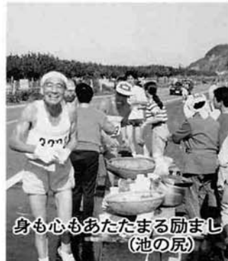
身も心もあたたまる励まし(池の尻)