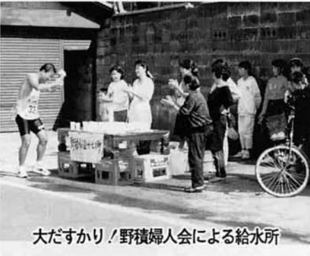
大だすかり！野積婦人会による給水所