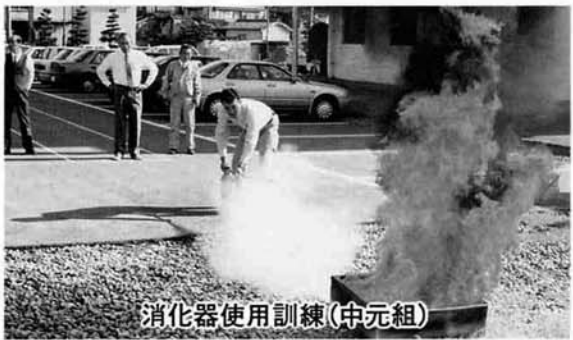
消火器使用訓練(中元組)

県下一斉に10月26日から11月1日まで実施され期間中、地区や事業所・各施設などで各種の消防訓練を実施しました。