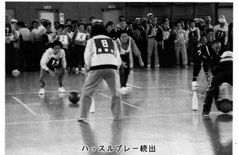
ハッスルプレー続出