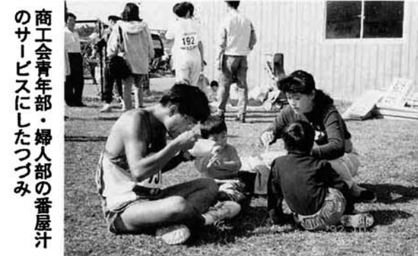
商工会青年部・婦人部の番屋汁のサービスにしたつづみ