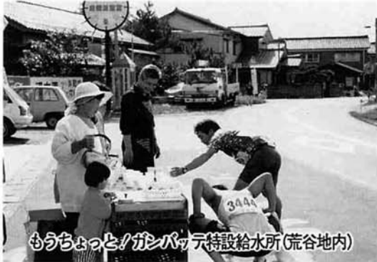
もうちょっとノガンパテ特設給水所(荒谷地内)