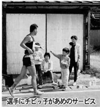
選手にチビっ子があめのサービス

このイベントが十四回も続けて来られたのも大会関係者皆様方のおかげと思っております。これからも寺泊町の大イベントとして続いて行くことを希望しております。