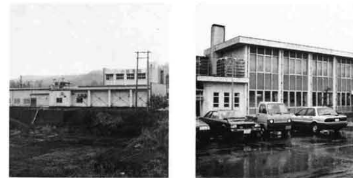
小国農業協同組合

法末小は112年の校史に幕をひき上小国小と統合。統合校・上小国小は4月1日、完成したばかりの新校舎で開校式を行いました。