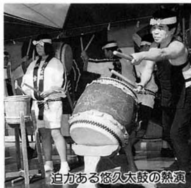
迫力ある悠久太鼓の熱演