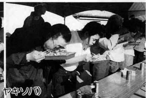
早食い競走三態（チョコバナナ・ポップコーン・ヤキソバ）

今年で三回目を迎える「産業まつり・コシヒカリとレンコンふれあい中之島」が、中之島町農協総合センターをメイン会場として開催されました。 「ジャンボおにぎり」とレンコンの中之島」として近隣の市町村にもすっかり定着したよう、町外からのお客様の中には毎年楽しみに待っているとの声も聞かれます。 イベントの目玉である「新米コシヒカリ十俵分のジャンボおにぎり」は今年も大成功。配布を待っていた皆さんも、きつと満足されたことと思います。 また、今年にはレンコン千本の無償配布にかわる事業として「町の農産物・秋のおすわいけ」と称し、先着二千名のうち千名に町特産の農産物が当たる大抽選会が行われました。こちらの方も、先着二千名とあつてか開始時刻前から長蛇の列。 残念ながらハズレた方、また先着二千名に間にあわなかった方は次回にご期待ください。さらに今回新しく行われた「早食い・早飲み競走」も多くの挑戦者と観客を集めました。やきソバやチョコバナナ、ラムネやレンコン最中等々、挑戦者の皆さんの食べっぷり、飲みっぷりに、驚きとも呆れともつかない歓声が上がっていました。 その他、中之島牛のバーベキュー試食会、植木市、鮮魚グルメ模擬店、金魚すくい等々、数多くの催しが開催され、のべ二万二千名もの観客の皆さんは、中之島の収穫の秋を満喫していました。