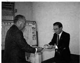
目録を手渡される東北電力(株)見附営業所長