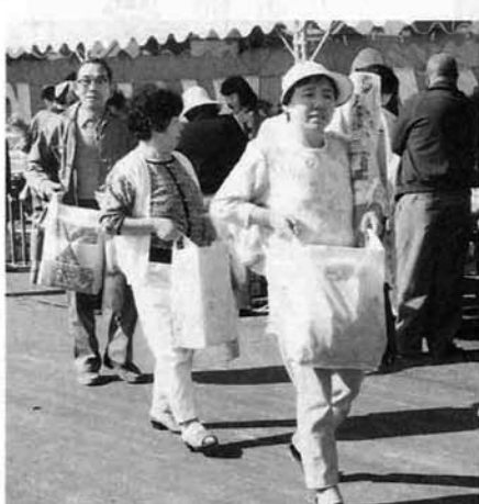
▲ あ～重い！！ こんなに買った～