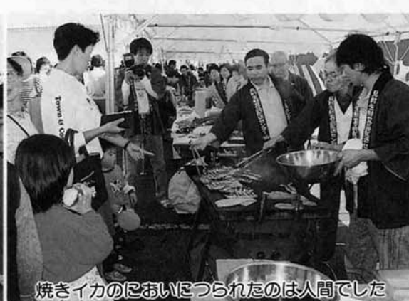
焼きイカのにおいにつられたのは人間でした