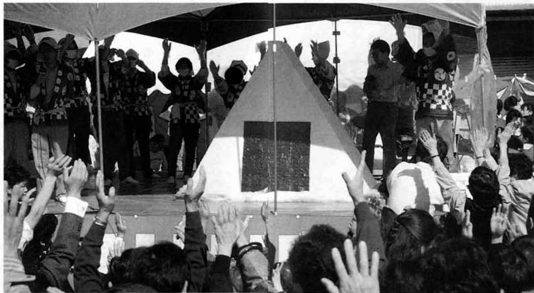
◀ バンザイ！ ジャンボおにぎり大成功