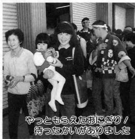
やっともらえたおにぎり！ 待ったかいがありました