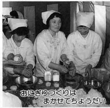
おにぎりづくりは まかせてちょうだい