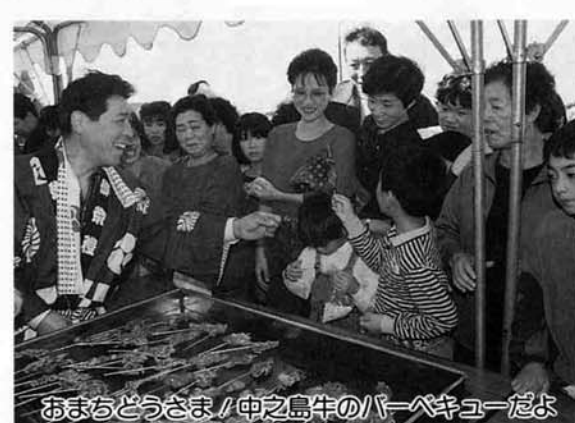
おまちどうさま！中之島牛のバーベキューだよ

今年で三回目を迎える「産業まつり・コシヒカリとレンコンふれあい中之島」が、中之島町農協総合センターをメイン会場として開催されました。 「ジャンボおにぎり」とレンコンの中之島」として近隣の市町村にもすっかり定着したよう、町外からのお客様の中には毎年楽しみに待っているとの声も聞かれます。 イベントの目玉である「新米コシヒカリ十俵分のジャンボおにぎり」は今年も大成功。配布を待っていた皆さんも、きつと満足されたことと思います。 また、今年にはレンコン千本の無償配布にかわる事業として「町の農産物・秋のおすわいけ」と称し、先着二千名のうち千名に町特産の農産物が当たる大抽選会が行われました。こちらの方も、先着二千名とあつてか開始時刻前から長蛇の列。 残念ながらハズレた方、また先着二千名に間にあわなかった方は次回にご期待ください。さらに今回新しく行われた「早食い・早飲み競走」も多くの挑戦者と観客を集めました。やきソバやチョコバナナ、ラムネやレンコン最中等々、挑戦者の皆さんの食べっぷり、飲みっぷりに、驚きとも呆れともつかない歓声が上がっていました。 その他、中之島牛のバーベキュー試食会、植木市、鮮魚グルメ模擬店、金魚すくい等々、数多くの催しが開催され、のべ二万二千名もの観客の皆さんは、中之島の収穫の秋を満喫していました。