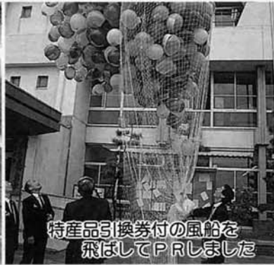
特産品引換券付の風船を 飛ばしてPRしました