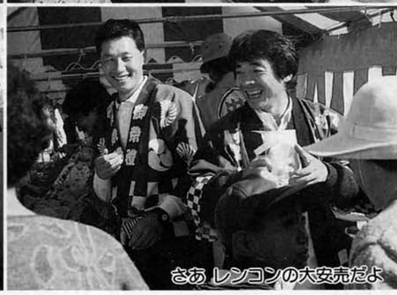
さあ レンコンの大安売だよ

今年も大にぎわい 二万二千名ものお客様 十月二十一日(日)、雲ひとつ無い秋晴れの中、