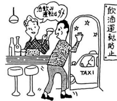
〈町内交通事故発生状況〉