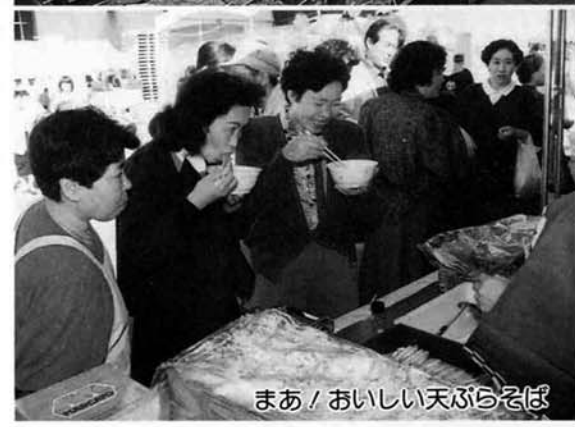
まあ！おいしい天ぷらそば