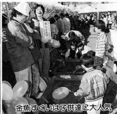
金魚すくいには子供達に大人気