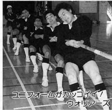
ユニフォームがかっこイイ！ ウオリアーズ