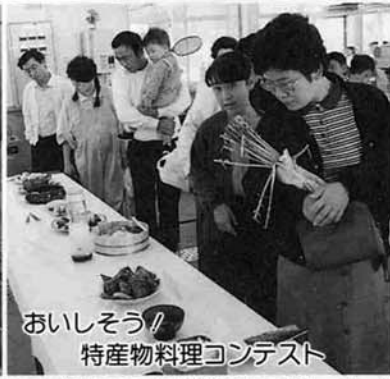
おいしそう！ 特産物料理コンテスト