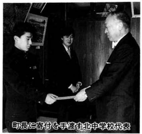
町長に寄付を手渡す北中学校代表