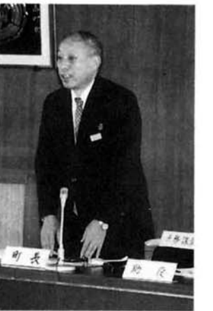
総額三十六億四千四百三十五万五千円としました。

■平成元年度中之島町一般会計補正予算について——補正額は、二億二千四百七十七万七千円を追加して、