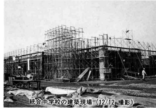
統合中学校の建築現場(12/12撮影)