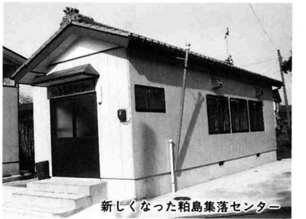
新しくなった粕島集落センター