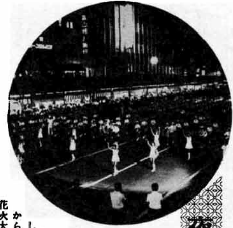
夜空をかざる七色の花

恒例の“長岡まつり”は、念して、仁和賀パレードや花火大会などの充実をはかり、まつりを盛りあげる予定ですので、皆様のご協力をお願いします。