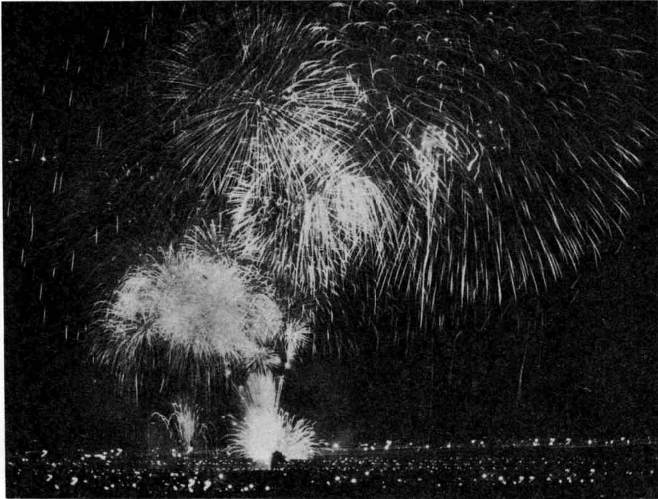
夜空を七色にかざる 花火