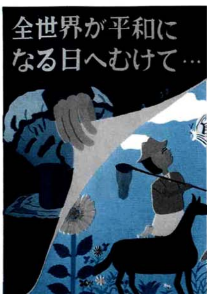
宮内中 3年 古田島 亜衣