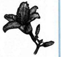
▲ヘメロカリスの花

夏の山野や道端などで、黄色やオレンジ色でユリの花に似たカンゾウやキスゲの仲間を見かけます。ヘメロカリスはこれらを改良した園芸種で、最近人気が出てきました。今後、緑地帯や公園、家庭で、急速に普及することが予想されます。今月は、新しい花ヘメロカリスの紹介です。