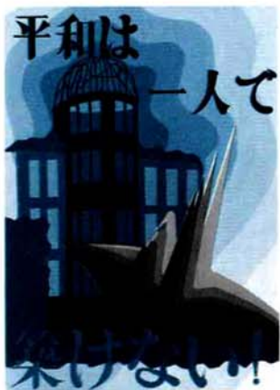
宮内中 3年 中島しおり