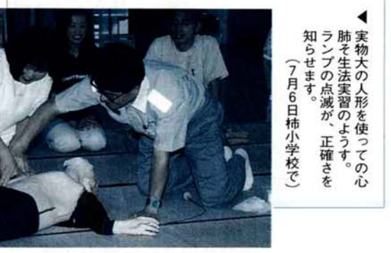
▲実物大の人形を使っての心肺そ生法実習の様子。ランプの点滅が、正確さを知らせます。 (7月6日柿小学校で)