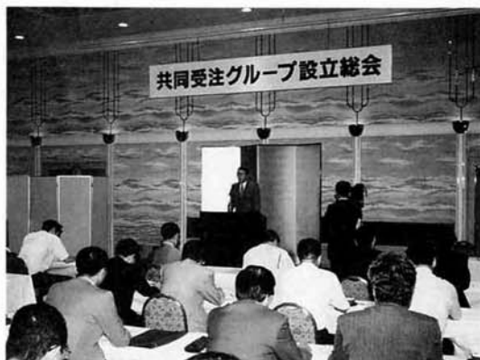
◀「新しい分野に挑戦したい」そんな声も聞かれた（設立総会で）

グループ各社の情報・技術・人脈などを組み合わせることによって、従来の枠を越えた受注業務が展開でき、個々の技術力の向上にもつながります。 この共同受注グループが成果を納めるには、会員相互の意思の疎通と信頼関係を築く