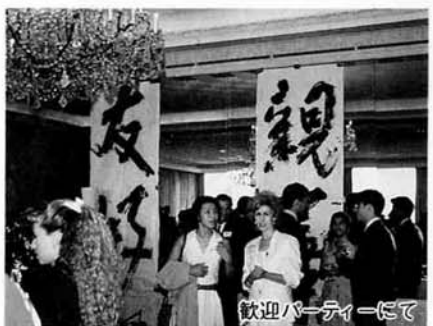
歓迎パーティーにて

に、素晴らしい花火をありがとうと伝えたい」という電話がたくさんかかってくるなど大変な反響でした。これまでの地道な交流に加えて花火大会の成功は、目に見える形で長岡を知ってもらうことに大変役立つといえるようです。