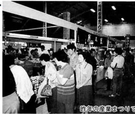
昨年の産業まつりで

日時 9月3日(土)、4日(日)午前10時～午後5時(3日は午後6時まで) 会場 ハイブ長岡