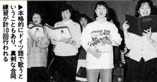
▶本格的にドイツ語で歌うというところもあり、真剣な合同練習が計10回行われる