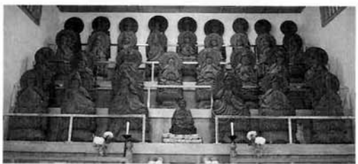
▶木喰三十三観音像