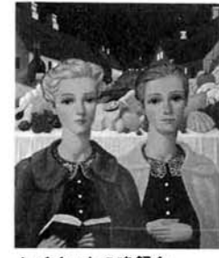
▲バベットの晩餐会