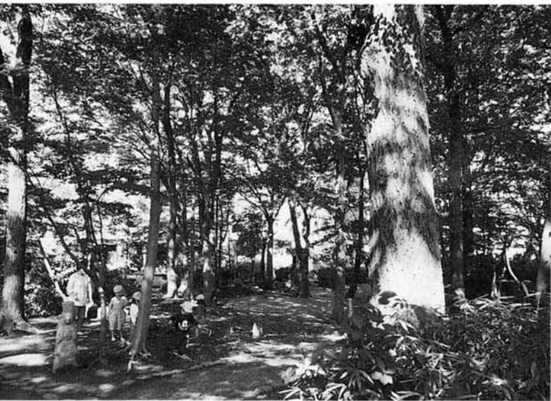
◀如是蔵博物館のある日本互尊社の雑木林