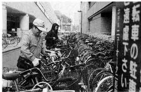
▲「自転車もそうだけど、バイクの移動が大変。腰にきますよ」と話す、駅周辺の自転車を整理するシルバー人材センターのみなさん

自転車駐車場の構造は、鉄筋コンクリート造り地下一階千八百六十八平方メートル、駐車台数は、自転車九百十二台、ミニバイク百八台の合計千二百台、地上部分には、二十八台収容の自動車駐車場を設けることにしています。