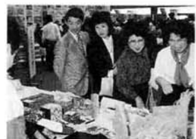
▲すこやか・ともしびまつり'92 ふれあいバザーで

貯蓄広報中央委員会編集の家計簿を頒布します。ご利用ください。 価格=330円 頒布時期=11月30日(月) 頒布場所=消費生活センター☎32-1002