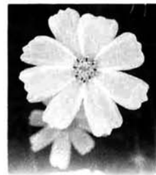
第 355 号