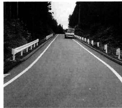
改良舗装された蓮脇線

円を積み立て、基金の決算年度末現在高を6億0,848万円としました。三島中学校に障害を持つ生徒用のエレベーター及び介護室設置を国庫補助金643万円を受け、1,942万円で整備し、重度の障害を持つ児童、生徒も健常者と一緒に教育を受けることができることとなります。次に、学校教員住宅が老朽化したので、日之出町の教員住宅を取り壊し、その敷地に高床式2戸建共同住宅2棟(1戸当り床面積、68・73平方メートル)を総事業費3,496万円で建設しました。