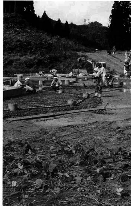
建設が始まった大杉公園管理棟

大杉公園は、平成8・9年度の2か年事業のふるさとづくり事業の一環として整備するもので、8年度は約2ヘクタールの公園内に植栽、芝生張り、パーキング広場の整備、遊具の設置あるいは電気、水道の整備等9,973万円の工事費のほか、9年度予定の管理棟整備設計委託料150万円の支出を行い、その財源として充当率75%のうち、交付税算入55%の通常債と交付税100%算入の財源対策債合わせて、9,080万円の町債を起し、自然環境に恵まれた家族連れや