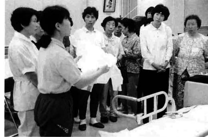
デイサービスセンター内での介護教室

を進めました。都市計画事業では、県事業の与板原線の街路事業に対し、2,000万円を負担し、町中心部の道路の拡張により歩道も整備され、景観も一変した美しい街路となりました。消防関係では、防火水槽を蓮花寺、藤川地内にそれぞれ1基ずつ1,442万円を設置し、小型動力ポンプ付き積載車2台1,514万円で購入するなど、地域住民の生命と財産を守るための設備を整備するとともに、自主防災組織の設立により、防災まちづくりの強化も図りました。