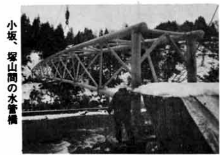
小坂、塚山間の水管橋