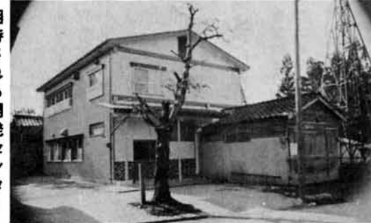
期待される開発センター

農業集落の環境を整備し集落開発を目的とした近代的な開発センターが岩野に完成しました。総事業費千百万円で延百九十三平方メートルには中会議室、調理実習室、対話室等四部屋。二階は大会議室、小会議室の二室で上下ともガス、水道を完備し多目的利用構造となっています。 農家組合、婦人会、青年会等の講習、講話会が行われているかわら、老人や子どもたちの憩いの場として広く活用されており、あかるく楽しい近代農村集落の確立に期待がよせられています。