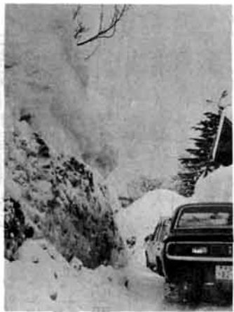
除雪した道路(四十八年豪雪)