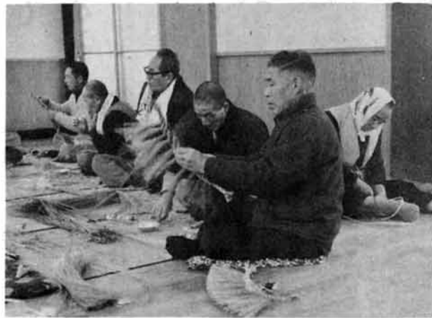
いつの間にか力が入るしめ縄作り

クスクと育ってこられたのであります。これからは一人前の人間として多くの権利が与えられます。これは独立した一人の人格として他人の干渉は一切受けなくともよい反面、社会人としての重い義務も生じたことを自覚していただかなくてはなりません。みなさんは成人としての輝かしい出発にあたって大きな希望と高い理想をもって歩んでいかれることと存じますが、その前に今一度