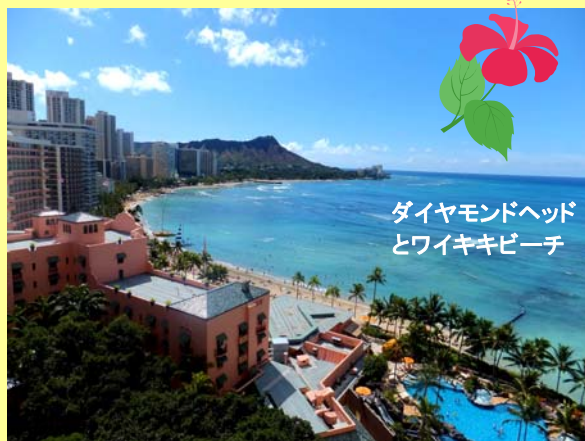
ダイヤモンドヘッド とワイキキビーチ