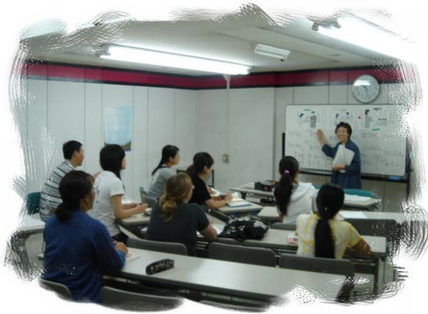
Sala de aulas do Curso do Idioma Japonês