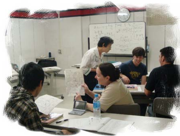
Leitura do livro e treino de conversação